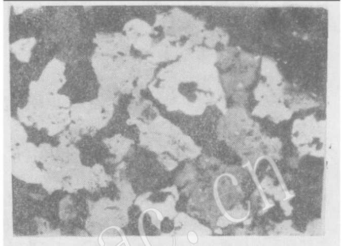
照片 2 煤层中硅质岩夹矸石 白色和灰色的颗粒为石英，其中的黑色斑点为炭质包体，正交偏光， \times 100

1. 矿物成分：到目前为止仍有人认为显微镜对粘土岩无能为力，所以不用此法。但对单矿物岩或以某一种矿物为主的岩石，用显微镜可以定出大类。如纯伊利石粘土岩、膨润土、高岭岩和碳酸盐岩等。鉴定方法较简单。对粘土矿物可首先用突起正负区分伊利石、高岭石和蒙脱石、 10\text{ \AA} 埃洛石，前二者为正突起，后二者为负突起。再观察干涉色高低，用以区分伊利石、蒙脱石和高岭石、 10\text{ \AA} 埃洛石，前二者比后二者干涉色高。（当 10\text{ \AA} 埃洛石脱水变成 7\text{ \AA} 埃洛石时，可能难以辨认）。粗晶粘土矿物如高岭石和伊利石在镜下不但能定名，而且可测出其光学常数。