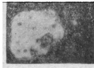
照片 3: 石英斑晶开始熔化, 出现均质玻璃边和斑点(暗色点) 01(p—1)100×